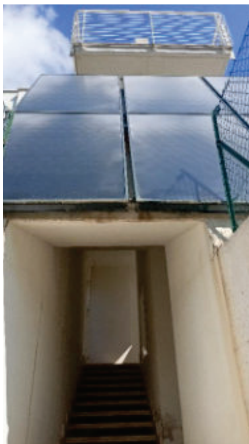
2- Vano scale Comune (Sub. 2-B.C.N.C.)