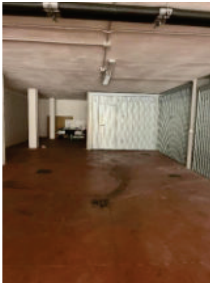
3. Deposito Sub. 4