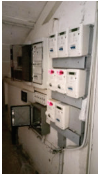
5. Quadro Contatori Energia Elettrica nel locale contatori