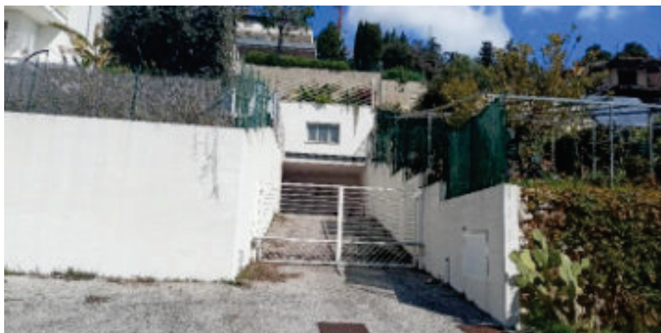
1 - Fronte principale edificio accesso rampa da Via dei Ligustri